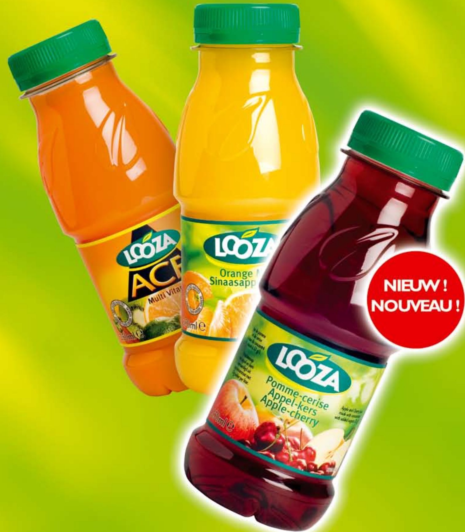
Sinaasappel Mix Orange Mix